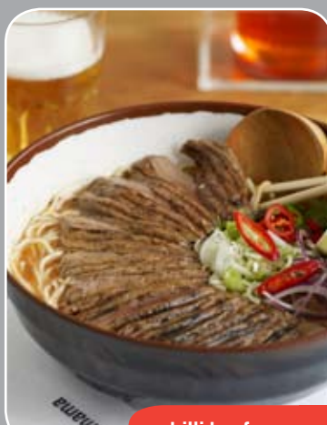
24 chilli beef ramen