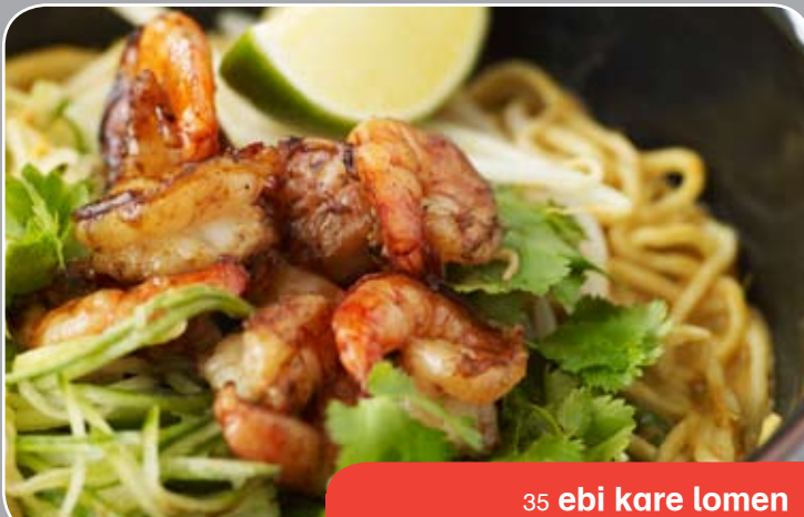
35 ebi kare lomen