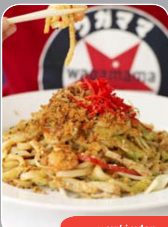
42 yaki udon