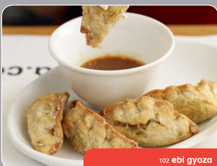
102 ebi gyoza