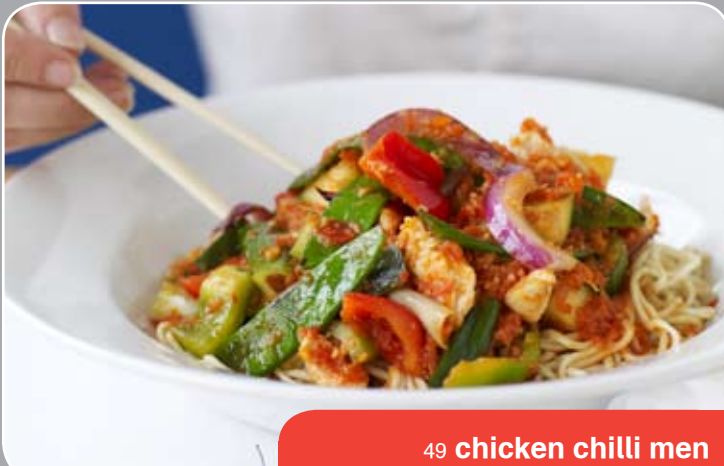
49 chicken chilli men

wij bezorgen vanaf € 15.- (ex. bezorgkosten) en brengen € 2.- bezorgkosten in rekening