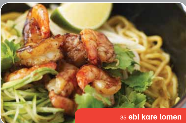
35 ebi kare lomen