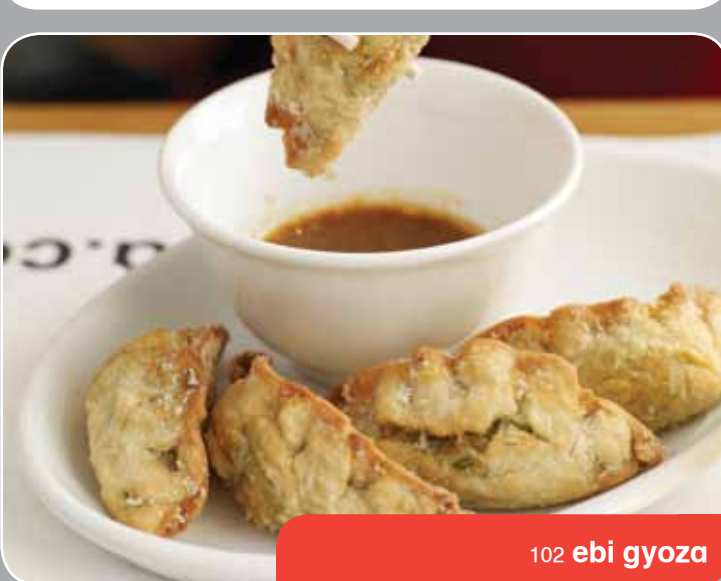
102 ebi gyoza