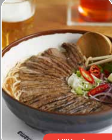
24 chilli beef ramen