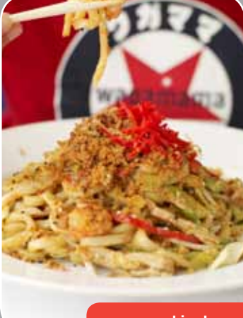
42 yaki udon