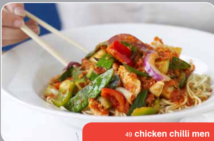
49 chicken chilli men

wij bezorgen vanaf € 13,- (ex. bezorgkosten) en brengen € 1.50 bezorgkosten in rekening